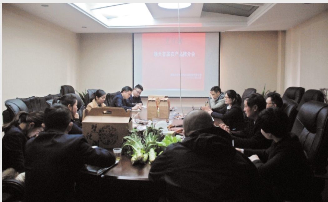
首届“楚辣湘”农产品发布会现场