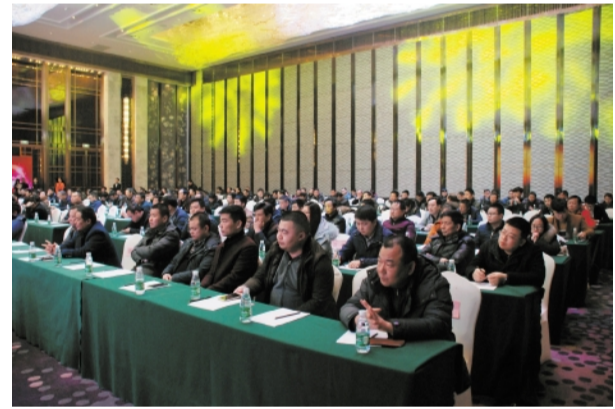
顺天建设 2015 年度工作总结表彰大会会场侧景