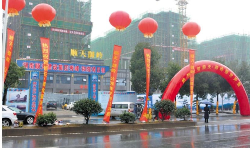
1 月 9 日顺天·御岭盛大开盘

上午 10 点整选房正式开始，而许多客户不到 9 点就已到现场等候，无不被顺天·御岭项目现场秀峰山公园的生态环境、高品质的建设施工所震撼。项目 10 点准时开盘，销售现场气氛火爆，甚至出现五六