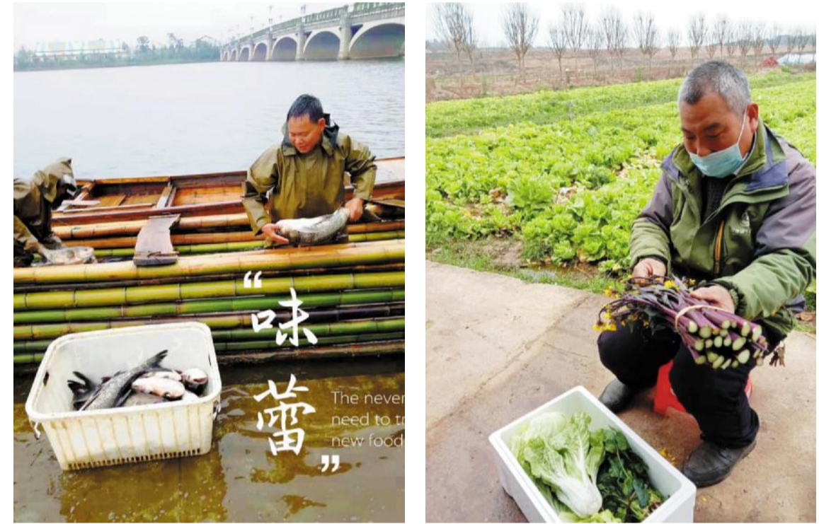
味蕾 The never need to be new food 洋沙湖生鲜鲜活鱼上网。