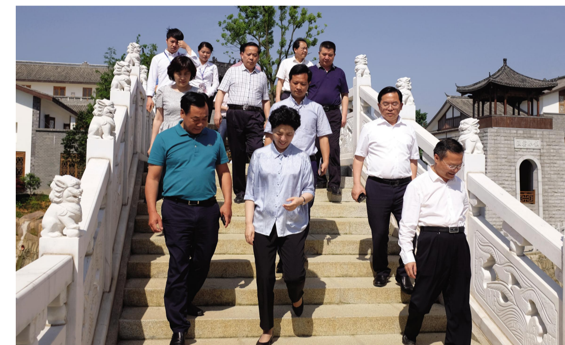
湖南省委副书记乌兰莅临洋沙湖考察 对项目成果给予高度评价。

徉于渔寮客栈，高尔夫体育运动公园以及水上运动中心可全方位满足需求，万众瞩目的欢乐水世界是中南地区规模最大、设施最先进、最具体验感的水上乐园……另外，几大跨国合作的旅游项目正在紧锣密鼓的筹备和建设之中，很快就会呈现在世人眼前，带来无与伦比的欢乐时光。 顺时永进，天道酬勤——湖南顺天集团十多年来始终坚守“品质建筑”迈向“品质生活”的全面转型和升级。乌兰书记在考察中，对集团“十年磨一剑”的匠心精神给予了高度评价，赞扬了湖南顺天集团跨出的“历史性一步”。洋沙湖国际旅游度假区这颗璀璨明珠的炫目光华，将吸引着越来越多的游客为之迷醉！ 供稿：集团党委办