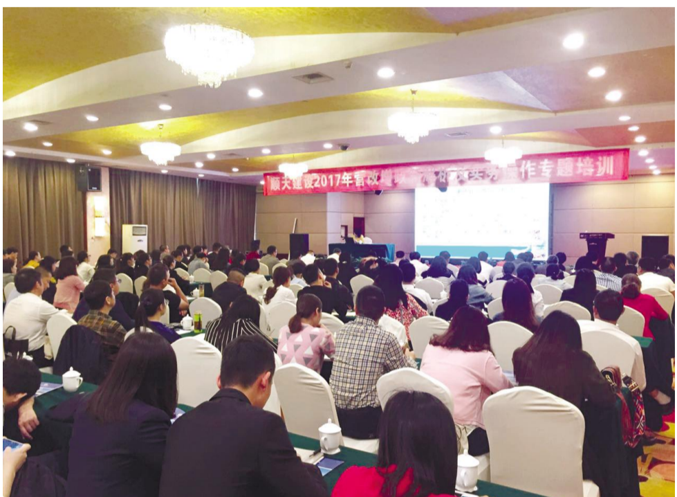
顺天建设举办“营改增”政策深度解析培训会。