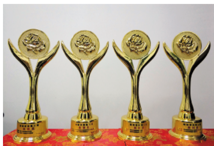
建设公司共有四个工程项目荣获“芙蓉奖”，分别为长沙师范学院北校区学前教育实验楼、秀峰·和院 2# 及地下室、城际铁路生态动物园站市政配套设施建设工程、宁夏银川市滨河新区黄河生态园项目一期水城工程。

【本报讯】近日，湖南省建筑业协会组织开展了“2017-2018年度第一批湖南省建设工程芙蓉奖”评