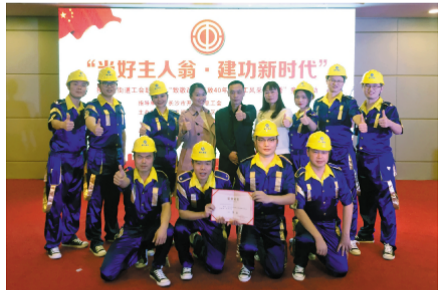
建设公司代表队夺得比赛第一名。