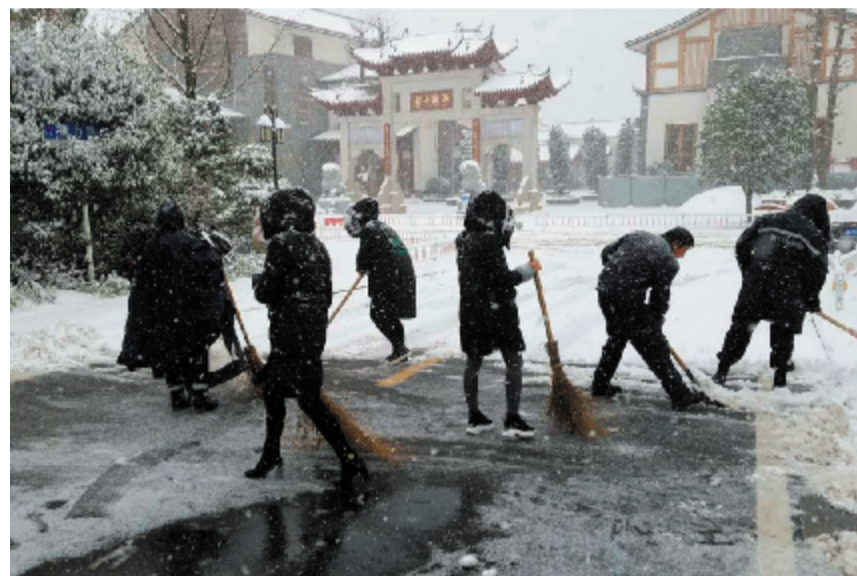
齐心协力，众志成城，清扫积雪。