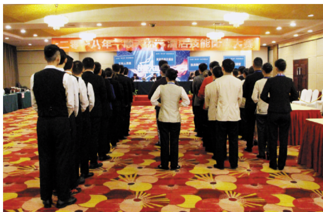
2018“顺天杯”酒店服务技能比武大赛现场。

【本报讯】为全面展示顺天酒店员工风采和企业形象，促进顺天酒店人才队伍建设，12月11日上午9时，由顺天酒管公司主办、顺天集团三家酒店协办的2018“顺天杯”酒店服务技能比武大赛在顺天黄金海岸大酒店隆重举办。来自顺天三家酒店约100名管理人员和员工参加了本次大赛。