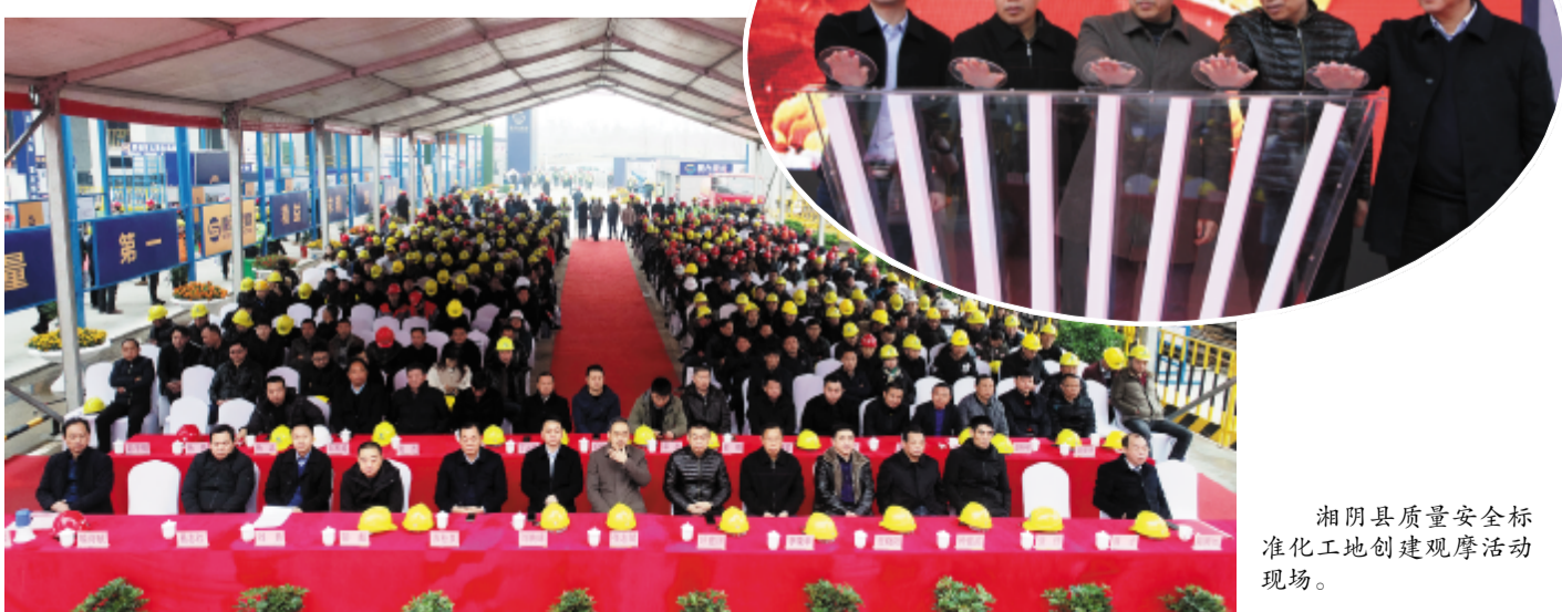
湘阴县质量安全标准化工地创建观摩活动现场。